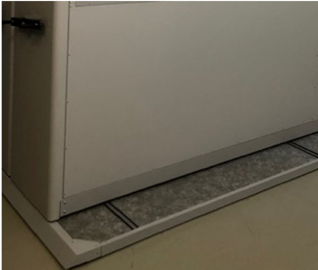
NADSTAVBA SO ZÁVESNÝMI SITAMI